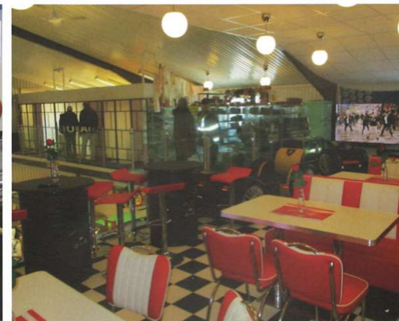
På övervåningen finns ett retrokafé och montrar fyllda med gamla saker.