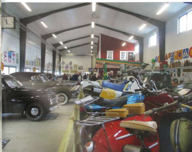
I hallen finns bilar, motorcyklar och mopeder. Längst bort en BP retromack.