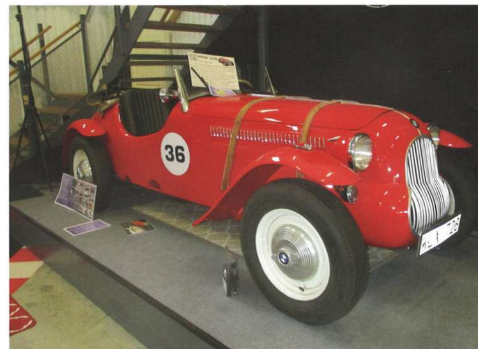
Den mest unika bilen är en BMW 319 Special från 1939 som hittades i Polen.