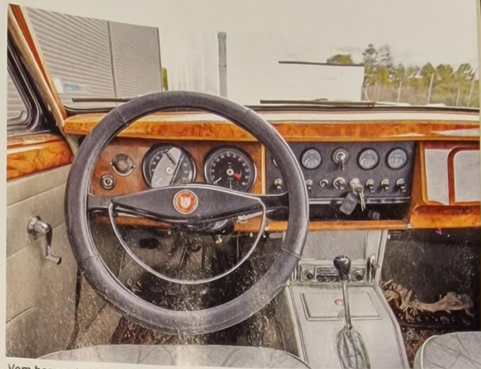
Vem har sagt att en sportig ratt ska vara liten? Den kan lika gärna, som i det här fallet, vara nästan som en bilratt. Mk 2:ans förarplats har god sikt och överskådlig placering av instrument och reglage. Att det är snyggt med valnöt och vippströmbrytare är en tacksam bonus.