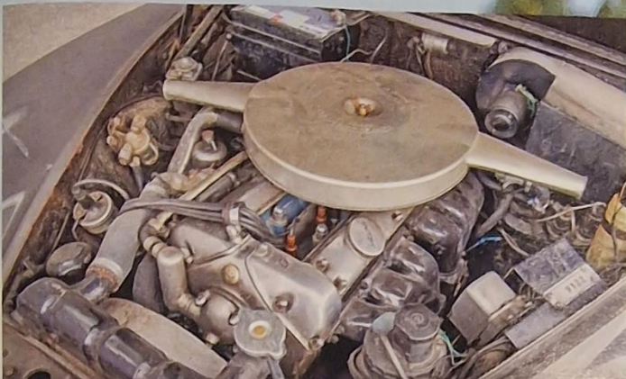
XK-motorn med anor från 1948 producerades i sammanlagt fem olika storlekar innan produktionen lades ned 1992. Rak sexa med dubbla överliggande kamaxlar. Davids 62:a är en 3.8 Litre på 220 hästkraft, bland det häftigaste som erbjöds i en sedan på den tiden.