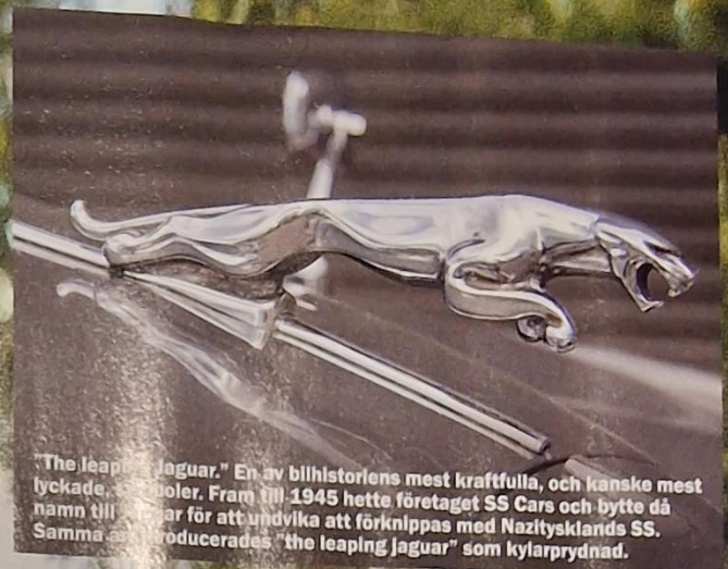
"The leaping Jaguar." En av bilhistoriens mest kraftfulla, och kanske mest lyckade, symboler. Fram till 1945 hette företaget SS Cars och bytte då namn till Jaguar för att undvika att förknippas med Nazitysklands SS. Samma år producerades "the leaping Jaguar" som kylarprydnad.