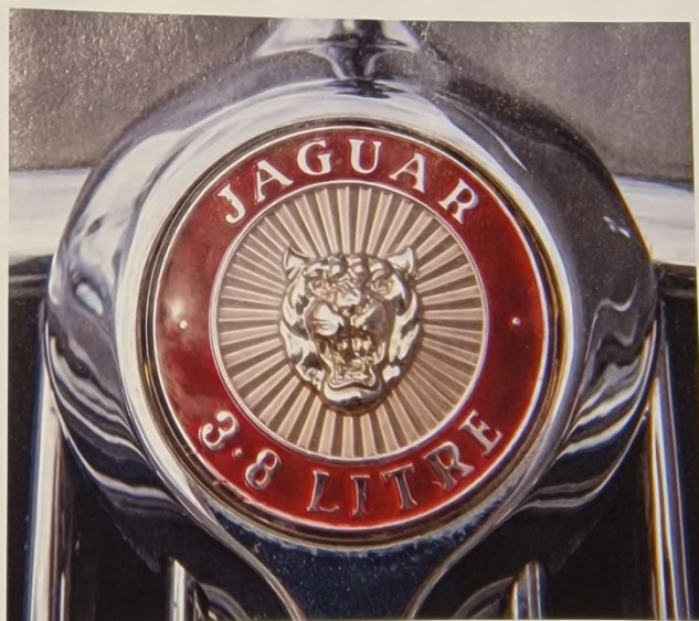
"The roaring jaguar." Numera silverfärgat katthuvud oftast mot en röd bakgrund, men på äldre Jaguarer som denna är katten guldfärgad. Biltillverkarna har som bekant alltid varit förtjusta i kattdjur och det finns en uppsjö modellnamn med kattanknytning. Däremot inte så många hundar. Whippet är en, men finns det fler?

► plats för en tillvaro med ett rikare utbud av nöjen, ett skarpare mode och en ny popmusikultur. Det var som en våg som sköljde över hela brittiska kungadömet, över Europa och kontinent efter kontinent. Världens centrum hette London. Men bara för att en ny tid var inne skulle man inte tro att britterna tänkte överge den brittiska stilen. Utseendemässigt var Mk 2 fast förankrad i traditionen med runda former och en inredning av ädelträ och läder. En muskelbil i skraddarsydd kostym av engelskt snitt, helt enkelt. Kanske inte heller